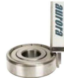
Differential method measurement (application of zero setting) Mesure de méthode différentielle (utilisation de la remise à zéro)